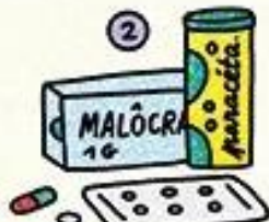
MÉDICAMENTS ET TRAITEMENTS

afin de suivre les consignes des autorités