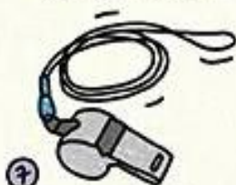
OUTILS POUR SE SIGNALER