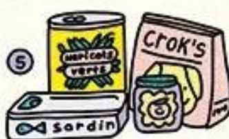
NOURRITURE NON PÉRISSABLE, NE NÉCESSITANT PAS DE CUISSON