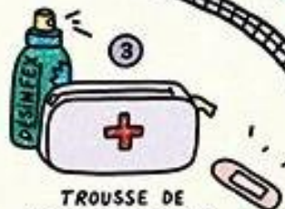
TROUSSE DE PREMIERS SECOURS