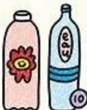
EAU POTABLE EN QUANTITÉ