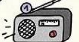
RADIO À PILES + PILES DE RECHANGE

afin de suivre les consignes des autorités