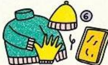
VÊTEMENTS CHAUDS + COUVERTURE DE SURVIE